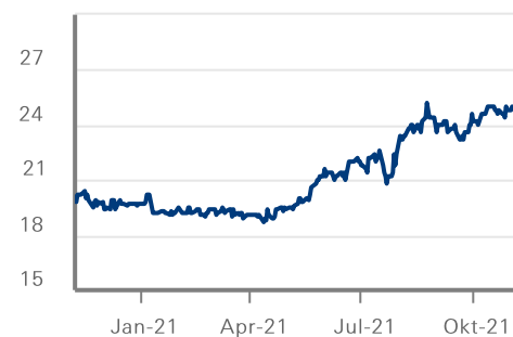
Kurs (in EUR)