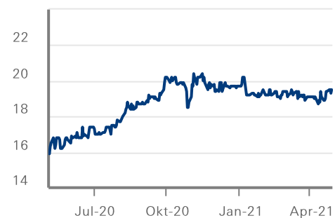
Kurs (in EUR)